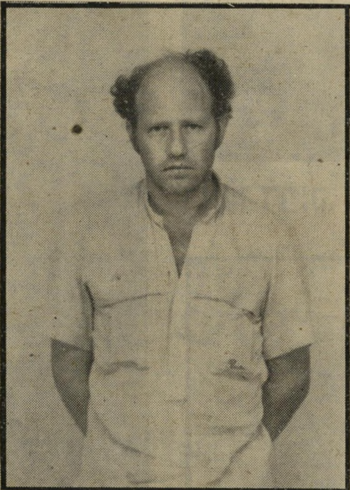
חשוד צבי גור פסיכופט קלאסי

לפסיכופאט. יש והוא מרגיש צורך לבצע משהו איום. אז בוחר לו הפסיכופאט את קורבנו בקפדנות. כך בחר החוסף באורון, רכש את אמונו וחטף אותו.