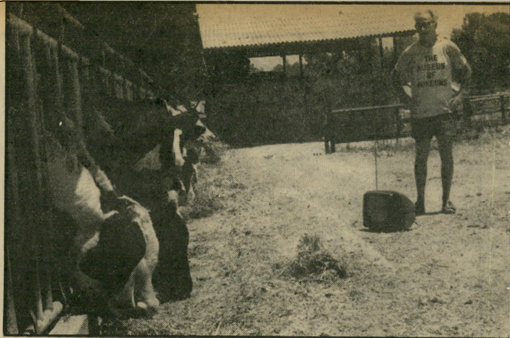
הפרות הקרושות של דוב אריינר אין תור כמו אצל פיקאסו

"סלע" דשין 197 42 51 51 ללקוחות ללא הוצאת הכלים