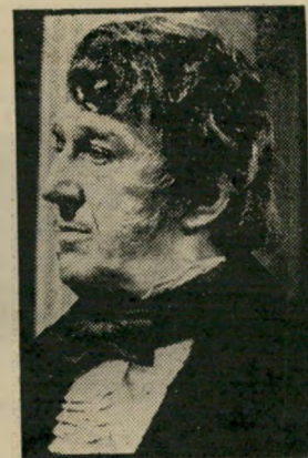
השפעות: רינגאם יום רביעי, שעה 8.03

● השפעות (8.00). החלק השני בסידרה המבוססת על סיפורה של ג'ין אוס'טווד.