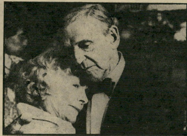
מישפחה הפוכה: אפטיור והויים שבת, שעה 10.05

● תמונה מישפחתית (10.00). הפרק לא בכל חזיר ממשיך בסיפור המבוכ של בני-מישפחה ריצ'ארד. ריצ'ארד משוחח עם מרג'ורי בדבר הרי-אפשרות שיהיה עליהם למכור את ביתם. מרג'ורי אינה הפצה בכך. ריצ'ארד וסוזאן פוגשים בבראיינט, במציע לו משרה. העניינים במקום העבודה ממנו פורש ריצ'ארד מסתככים. ● המקצוענים (10.50).