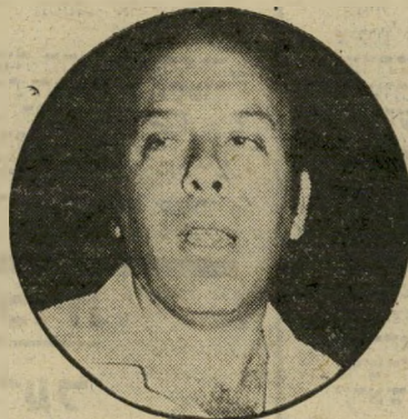
יום יוני הורביץ האב אישר

ל וא אישרו הדברים רשמית. היה נדמה כי זוהי המצאה. מי יאמין ש' במדינה. המתימרת להיות מעורבת-דמוקרטית-המערבית-בימורחתי-מכון. והנושאת את טוהר המידות על נס. יקרה כדבר הזה? אילו קראנו כי במדינה דרום-אמריקאית מפגרת. או במדינה אפריקאית מושחתת, אישר שרי האוצר לחברה השייכת לבניו הטבות המזיקות למדינה והמעשירות אותם. לא היה איש מתפלג. אולם כאשר הדברים קורים במדינת-ישראל, ואין הדבר מעורר אפילו זעזוע או תגובה שלילית ומתקבל כדבר טבעי, הרי שניתן לומר רק דבר אחד על הממשלה זו: "הם איבדו גם את הבושה!"