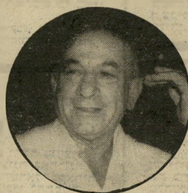
שר ייגאל הורביץ הבן ירויה

כמה חודשים הסכים הורביץ ל' רוג מהנוחה, ולאשר את הסכמי שרי-השיכון עם חברת-הבנייה של יעקב מרידור. דויד לוי ויגאל הור' ביץ מכינים זה את זה.