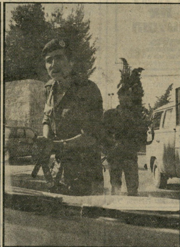
מישמר-הגבול מאיים בנשק טעון על הכתב, פגיעת הכדור בנגד (מוסמן כחץ) לחוץ בקלות על ההדק, לפגוע בקלות. גם להרוג בקלות

אחריו. אנשי מישמר-הגבול קפצו מהג'ים ועמדו מול המכונית שלי, כשהם מכוונים אלי את נישקם. כשראה נהג הקאדילק כי דרכי חסומה, המשיך בדרכו.