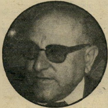
ככה הוא נראה

מסקנה שאין להשלים יותר עם קיום ה"טלוויזיה בכנסת". ומה, חושבים אתם, קרה באותו אמש גורלי? היה בכנסת דיון על פרשת התנח"לות האוחלים, ותחת להביא מדבריהם של עשרה חברי-כנסת שהתבטאו בנושא, הביאה הטלוויזיה רק מדבריהם של שניים. אך לא רק זה הפריע לגוסטב. ה"טלוויזיה, כך מתברר, הופכת את חייו לניהולם במובן הטכני ממש. בכישרון תיאור מופלא מתאר גוסטב הגדול את המתרחש: "בעת הדיון בכנסת הדליקו וכבו האורות לסירוגין ופירקו והרכיבו מחדש מיתקן הטלוויזיה, כל זאת במג"מ לתפוס רק המנוחך, הנלעג והמשע"שעי". ממש חוות-ידעת מוסמכת של מהג"דס. ובדיאן מסכם: