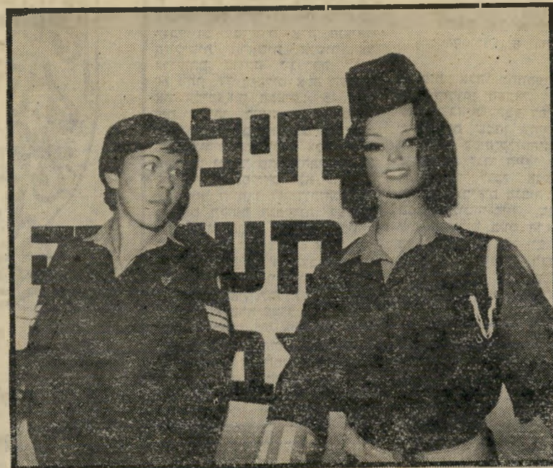
שוטרת-צבאית ליד כוביה כמרי שוטרת-צבאית

הליך הכרזת חייל — סדיר או מילואים — כעריק הוא ארוך ומורכב. אם נעדר החייל ללא רשות עד שבעה ימים, חייבת היחידה שלו לערוך בדיקה ברישומיה, לבדוק אם הוא בכלל היה צריך להיות ביחידה, ולשלוח לביתו את חבריו