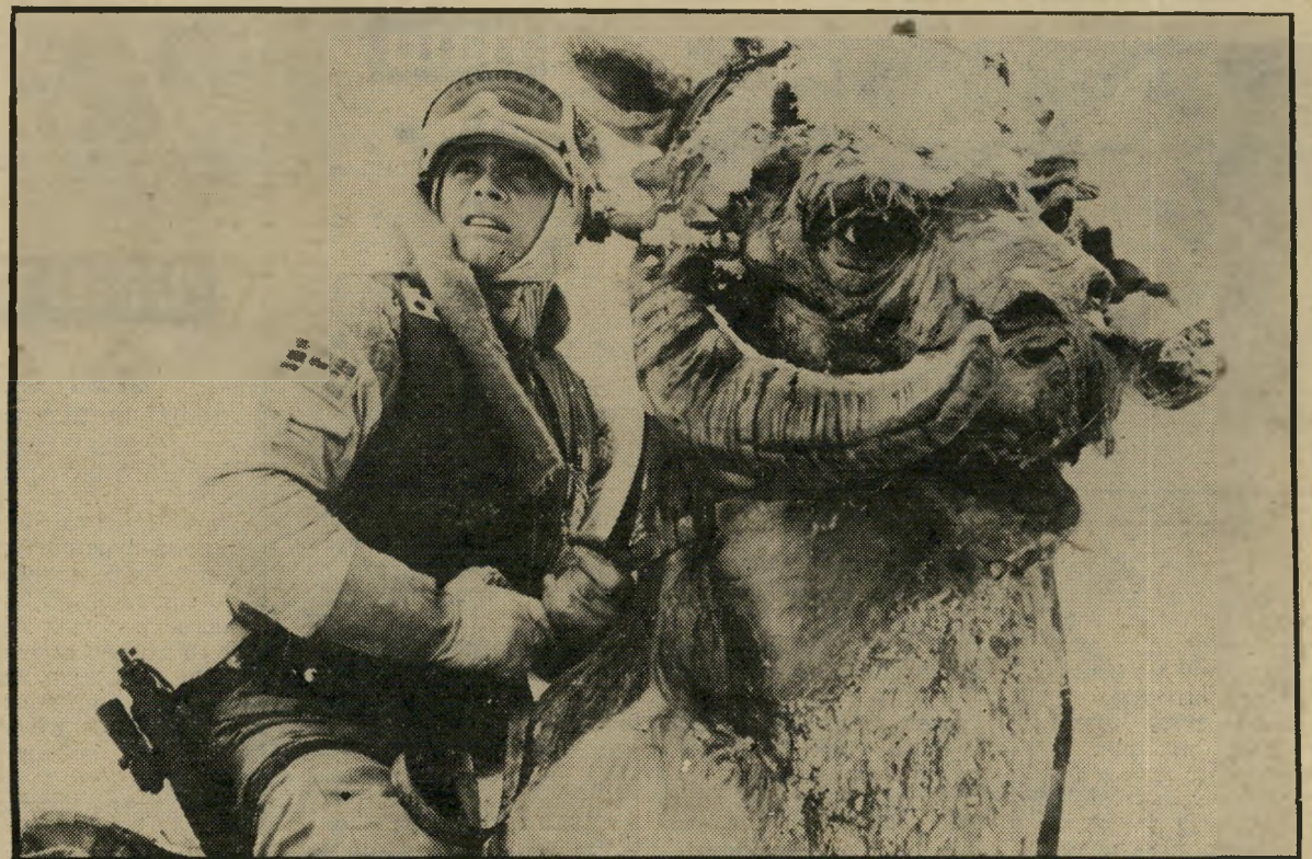
גיבור רוכב עז טונטון — היה כמליירכב ככוכבזכת ראש של איל ופרווה של למה