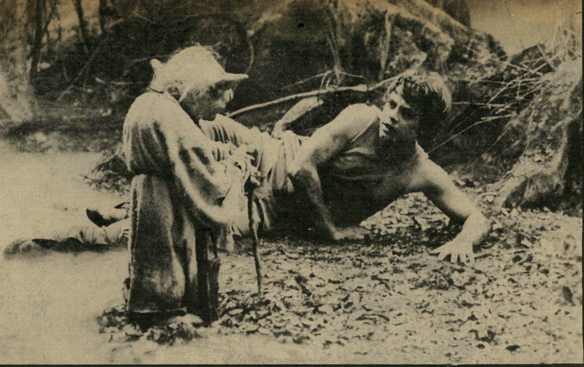
מארק האמיד עם יודה, המיפלג בתפקוד המזומר המצחיק של פראנץ אוז מעצב החבובות

בכותרת שבה נפתח הסרט החדש נאמר שזהו הפרק החמישי של פרשת מלחמת הכוכבים. מאחר שזה המשך ישיר של ה סרט הקודם אפשר להסיק מכך שהוא היה הרביעי. מסביר ג'ורג' לוקאס, שהתוכנית