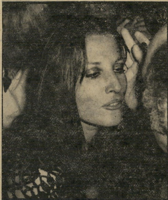
קולט כיושר הפעם הפרידה סופית