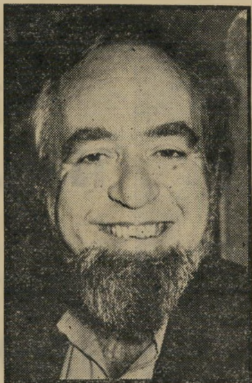
נתן זך יחי הצעירות

מי שאוהב שירה, אוהב את נתן זך, ומי שאוהב את נתן זך, בוודאי ישמח שהמשורר הזה עומד להציף אותנו בשירי- רים רומנטיים נוגעי לב ומלאי רוך. לא