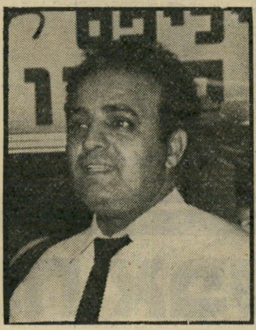
יבואן נדב כמה שזוה קובז

הנספח המיסחרי של שגרירות ארצות-הברית בישראל פנה למישרד-התע"ש וביקש הסברים לכוננתם של שיל-טונות-המכס לשנות את תקנות-המכס על ייבוא מקררים, כך שמקררי חברת „אמנה“ יופלו במכוון ובמיוחד לרעה. תקנות המכס כיום מחייבות תשלום מסים לפי הנפח הפנימי של המקרר. עד נפח של 450 ליטר קיים מכס ב-שיעור מסויים, ומעל נפח זה קיים מכס גבוה יותר. נפח מקרר „אמנה“, הקרוי 16 קוב, הוא 448.5 ליטר. המכס חייב את היבואנים „סלון מרכזי“, לשלם מכס לפי התעריף הגבוה, וטענו כי הנפח הפנימי גדול מ-450 ליטר. הסלון פנה למכוון-התקנים והציג מימצאי בדיקה