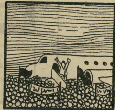
החבר מושג מוגיע לביקור בישראל

הסיבה היחידה שהתוכנית - הנקראת, כמובן, בשם הצופן "אריה במידבר סהארה" - לא הופעלה, היא, שחוששים כי בטעות יימצאו כך המתנקשים בשכעה ובחלף, והרי אין זה מתפקידה של המיטרה לערוך חקירה זו.