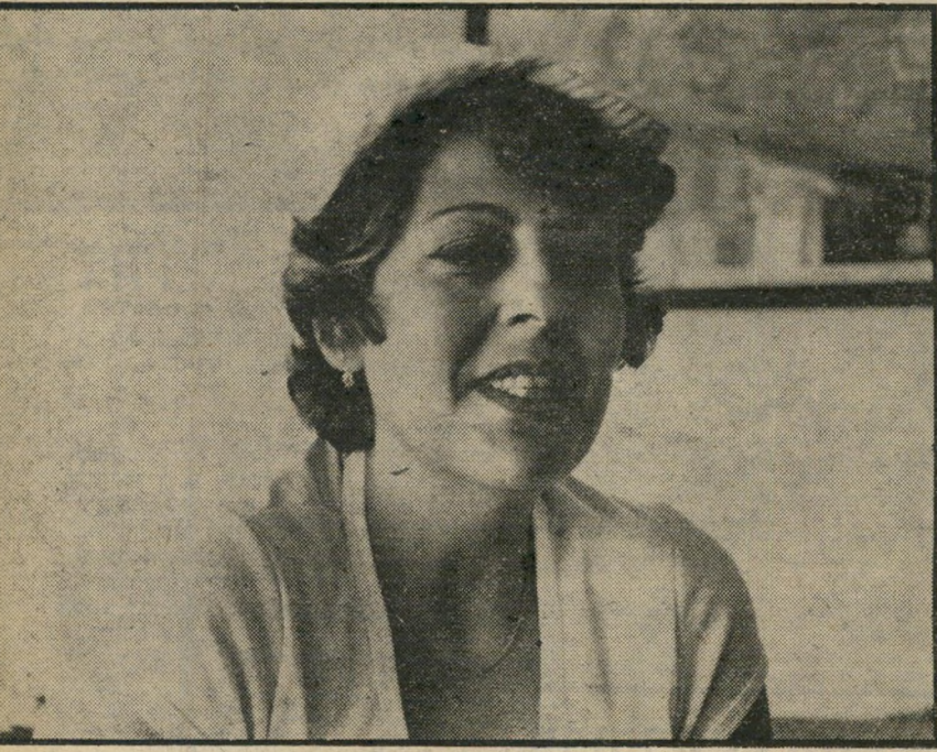
שוטרת-תיירות חיה מכות ויריקות

כיום קשה להימצא זמן רב באיזור בתי- המלון בעיר. באוויר עומד ריח חריף של צננה, הבאה מהביוב העירוני. אנשי אילת כבר התרגלו לצננה, אולם התיירים ממשי- כים להתלונן. לפני כחודש התווסף לסירחון, "הקבוע" סירחון נוסף. אחר מבורות-הביוב גלש,