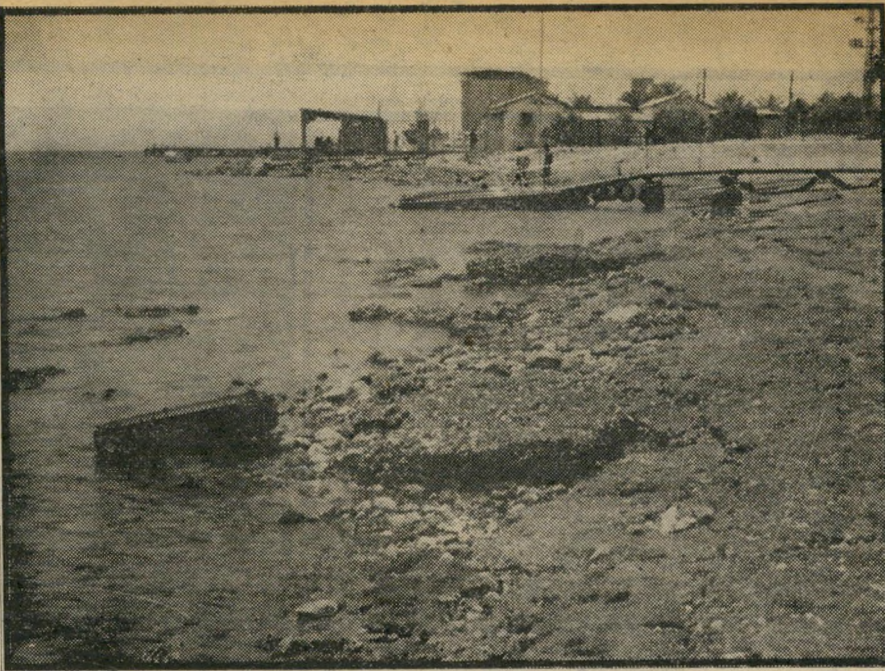
החוף הצפוני-מערבי בשבוע שעבר