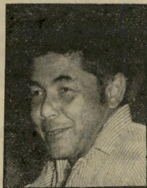
כמי נחמיאס רשע וטוב לו

מטרתם העיקרית של היהלומנים (המהווים, להפתעת צוות אמיץ ונמרץ, שנעים לעבוד במחיצתו) היא להיערך לעתיד, כדי למנוע הישנותם של מעשי הונאה כאלה ודומיהם. לכן בחרו בנו... מבחינה ציבורית-כלכלית מהירה וזה התארגנותם של היהלומנים צעד מהפכני וחשוב, ואולי ביטוי