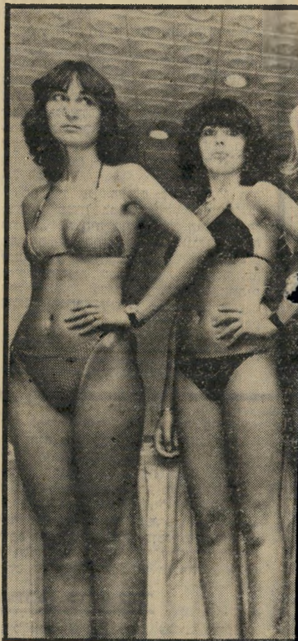
הן עדיין מתוחות, אחרי שעתיים של הצגת "קשה לחייך במתח כזה" הן אמרו: נברו את השלב הראשון חיפתה על הכל.

המיון הראשון הוא גורלי למדי להרבה נערות. מתוך המאה שנבחנו נבחרו רק שבע־עשרה מועמדות. השאר ידעו מיד כי לגביהן תחרות זו נסתיימה. לפני ה-