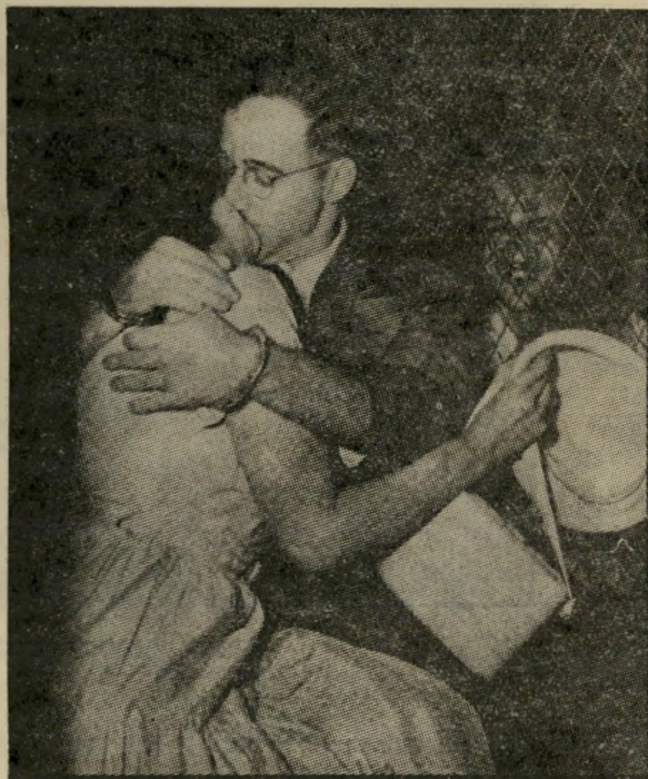
אתל ויוליוס רוונברג 19.6.1953

ועוד באותו היום: הממשלה הפולנית הגולה מגיעה ללונ-דון וקובעת בה את מושבה. 22.6 — שליחי צרפת הנכי-נעת נקראים על-ידי היטלר ל-אותו קרון רכבת ביער קומי-סיאן, שבו חתמו הגרמנים הי-מובסים ב-1918 על תנאית של צרפת, כדי לחתום על התנאים