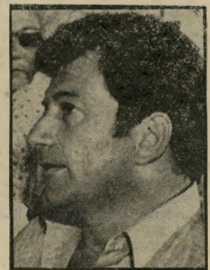
עוזר-שר לנדאו נטיעת לילה

בכתבה נאמר, כי שרה-חלקאות אריאל שרון יצא לחברון במסוק. מן הכתבה השתמע, כאילו האיחוד בפנינו הנפגעים מחברון, אם אמר גם היה כזה, נבע מעיכוב המסוק,