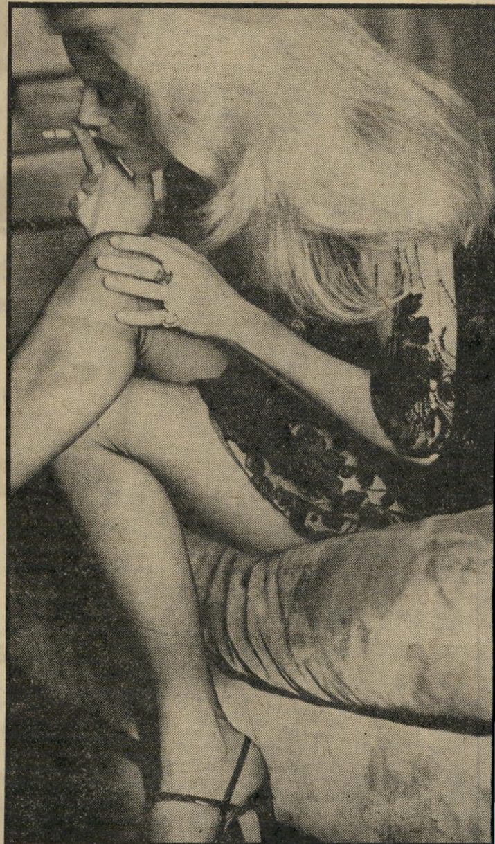
שנות ה'70: קאתרין דנב

בשנות ה'60 עלתה לצמרת כוכבת מסוג שונה, רומי שניידר התפרסמה בסיטי ועד היום היא המעניינת ביותר מ-בין בנות תקופתה: ברייט ברדו, סופיה לורן וג'יין פוני-דה. בשנות ה'70 טיפסו מעלה מעלה רקל וולש, מיריי דארק ופארה פוסט, אך הצרפתים אהבים מכל את המלאך ה-אלגנטי — קאתרין דנב. דנב, המדגמנת עבור שאנל, היתה לסמל המתירנות המינית ל-סירבה להינשא לרוז'ה ואי-דים, אבי בנה. בשנות ה'80 בולטת איזבל אדג'אני בעלת היופי הרומנטי. נאסטאסיה קינסקי מאיימת להיות כוכבת רצינית, אך לפי שעה נתונה הבכורה בדעת-הקהל בידי בו-דרק, בעלת הפרופיל המושלם והגוף החטוב, שהופיעה ב-10 ומסריטה עתה את היא.