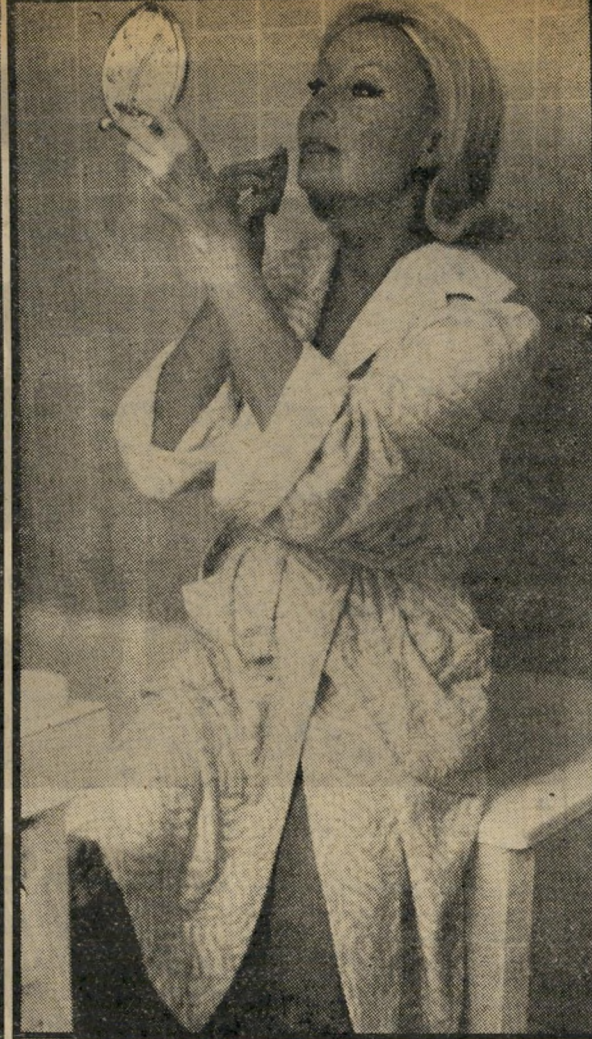
שנות ה'40: מישל מורגן