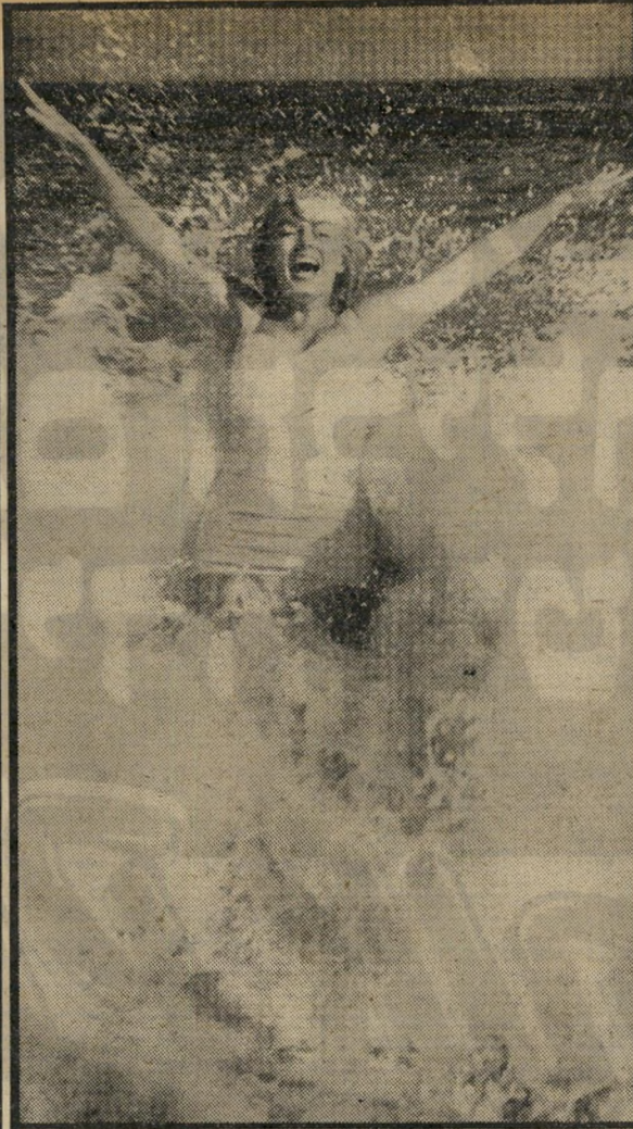
שנות ה'50: מרילין מונרו