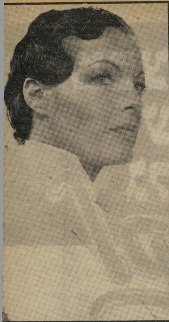
שנות ה'60: רומי שניידר