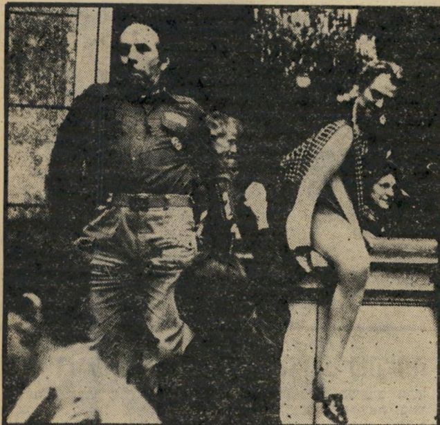
האורחים יוצאים מחלונות האליזה לגעת באב-הקדוש