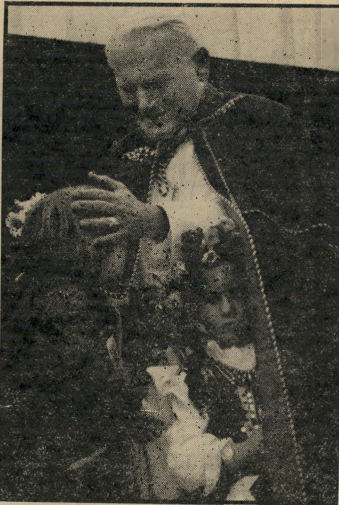
האפיפיור נפגש עם ילדי עמו בשדות-מאוס