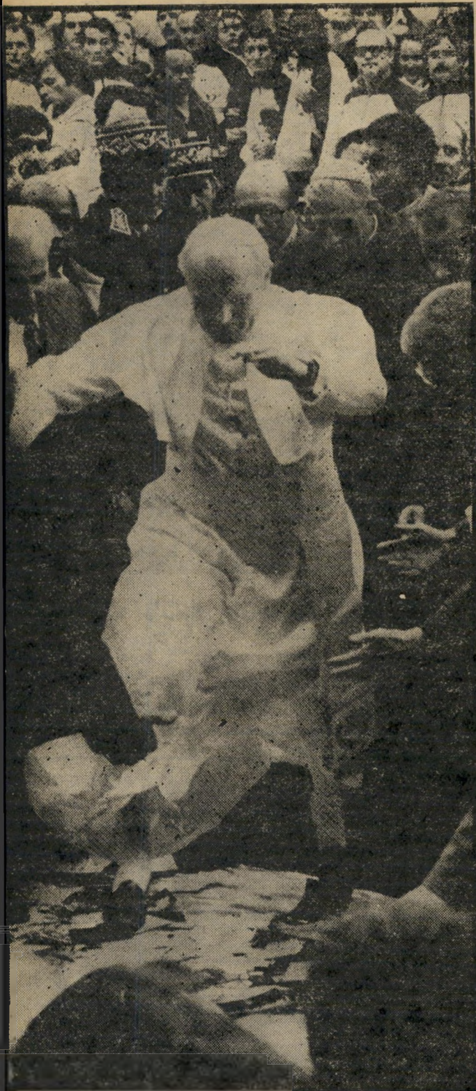
האב-הקדוש מרקד על 50,000 גלויות-ברכה