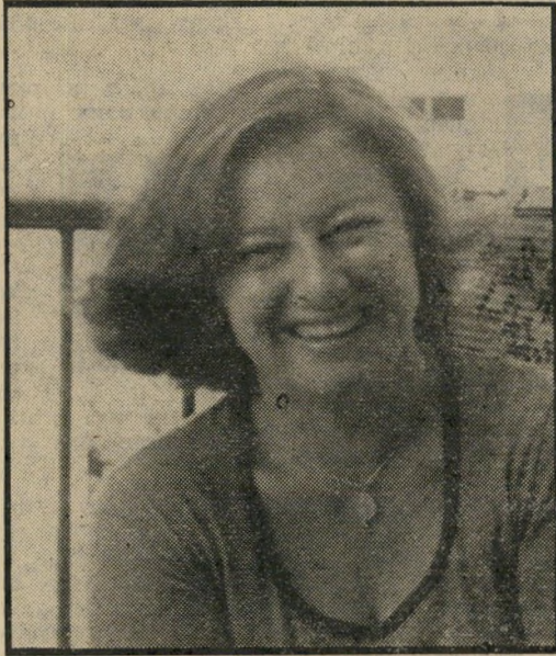
מה שחשוב לי כאשה הוא, שאני נאלצת לחיות בעולם המנוהל ברוח המעשים בהם אין לי יד ולב, ושכל הווייתי כאשה עויינת אותם.

חברתית אומללה שנלכדו בה. הלוואי וכמה מן הגברים, המכלים את כשרונותיהם בהמצאה ובעשיה של זוועות, היו מתלכדים לקבוצות-עבודה הכוללות רופאים, פסיכולוגים, אנתרופולוגים, סוציולוגים, כימאים ועוד — ומנסים למצוא תרופה למחלה הנוראה ביותר.