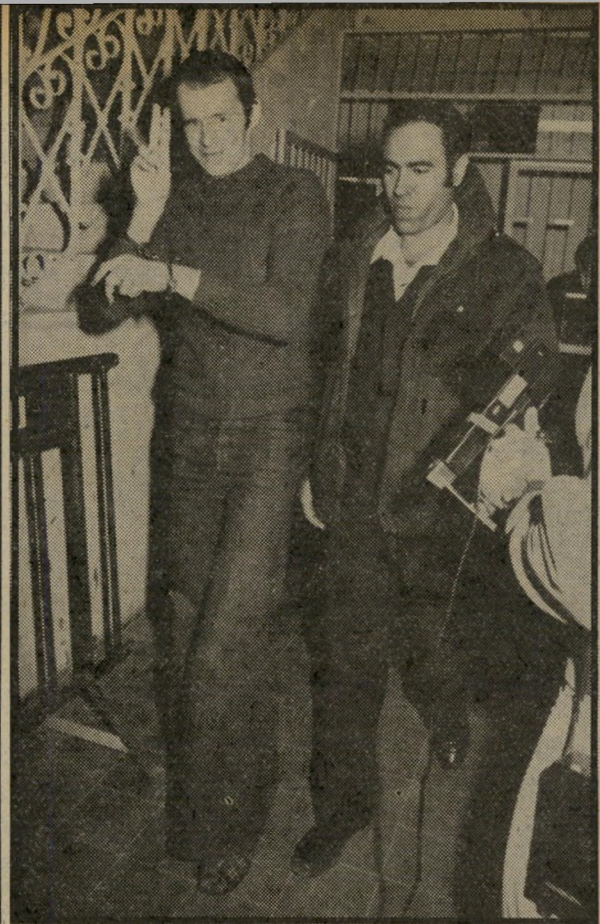
יזחק קיש מאסר עולם