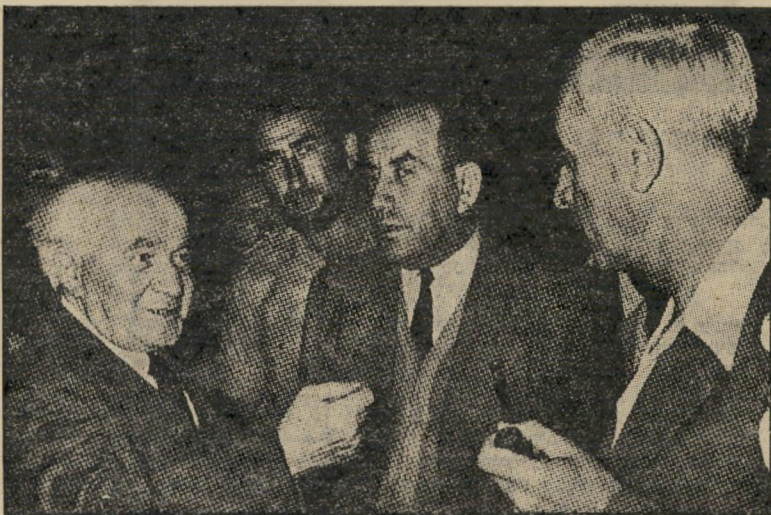
נצר בין פינחס לבון לבן-גוריון

לפתע הגיעה ידיעה שבן-גוריון עזב בכעס את הוועידה באמצע נאומו של גולדה. הלכנו מיד לביתו בשדרות הקרן-