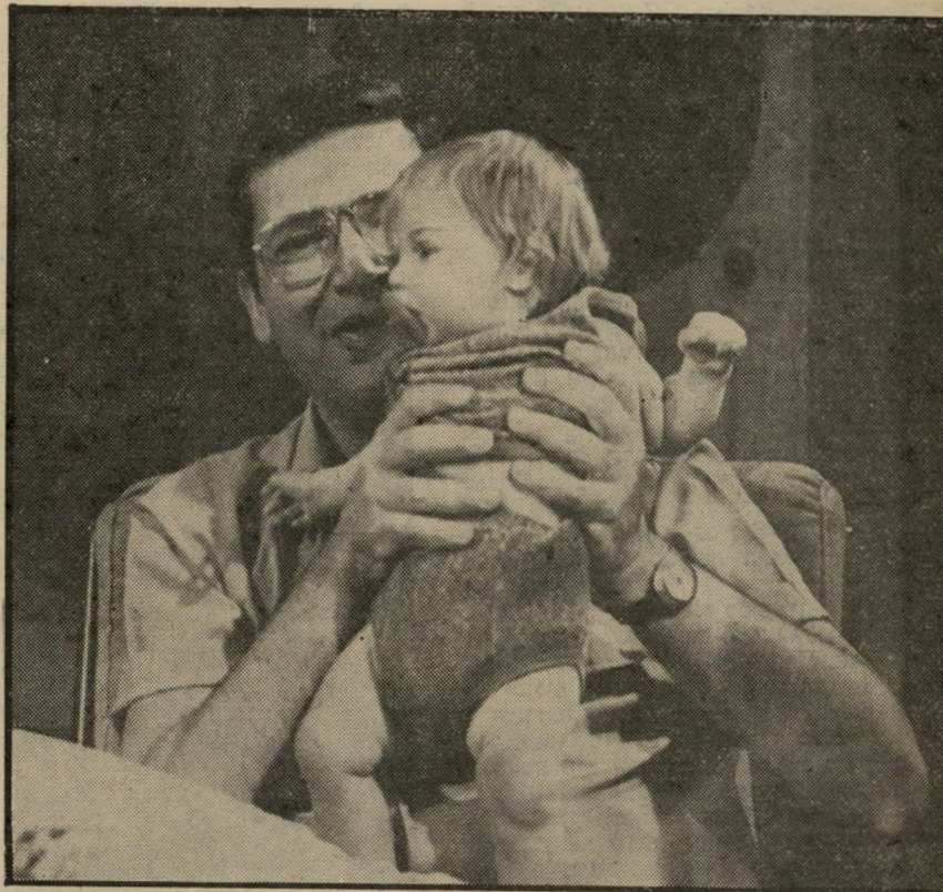
מגיש פאר ותינוק המחשה טלוויזיונית

לביארי נוטה להיענות לבקשת הכתבים שלו, אך ידוע לכל שאלון לא יוותר בקלות. הוא מתכוון להגיש פנייה לבית-הדין הגבוה לצדק נגד הדחתו, ואף לעורר