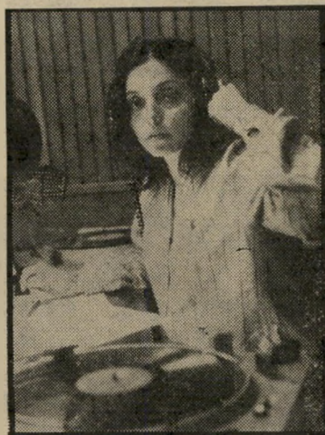
עורכת-תוכניות למרן דריסטר-גל לפמיניזם

היה להם נימוק טוב: "הטלוויזיה יכור לה לקבל שידורים מהלוויין, מבלי להיות במוסקוה, אך ברדיו אין שידורים ישי-רים, ואנו לא נוכל לשדר דבר". חרף ההגיון שבדבריהם, נדחתה הדרישה על-ידי הנהלת הרשות.