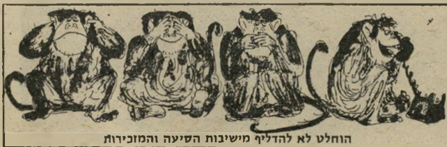
הוחלט לא להדליף משיבות הסיעה והמוכריות

לנשפי מלכת המים 1980 אשר יערכו באילת, אשקלון, טבריה וחורשת טל, תגענה המתמודדות באוטובוסים הממוזגים והמרווחים של חברת