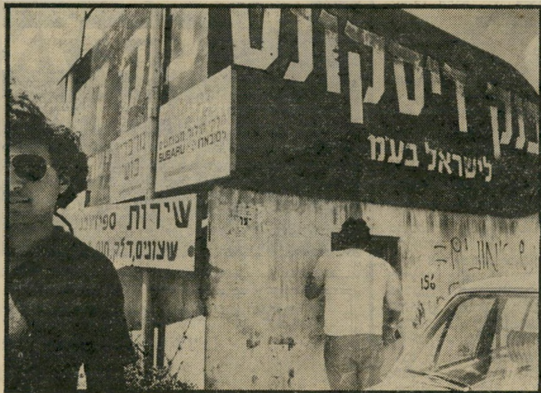
השומר של "דיסקונט" בחקירת-המריבה • דרך חסומה