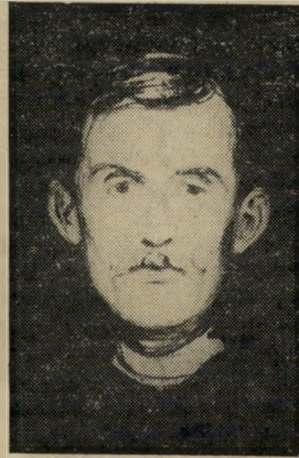
אדוארד מונק דיוקן עצמי

מונק צייר מדונה, אשה קדושה שהמין אינו נקשר לדמותה. מונק ציירה עירומה, חושנית, כשברקע, במיסגרת, צפים תאי-זרע ובתחתית