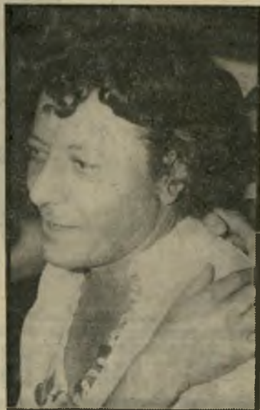
מישה ינוקא ירדה במכירות

אני חושבת שהנהלה החדשה של חברת ארקיע צריכה לקנות לורד כרטיס טיסה, לכיוון אחד, לכל מקום בעולם שבו היא