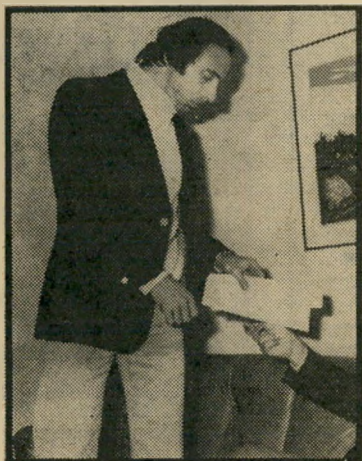
דובר עמירב בלי חגט

עיתונאים רבים, ביניהם ג'עבר, הוזמנו ללוות את האלוף בסירו ברצועת-עזה.