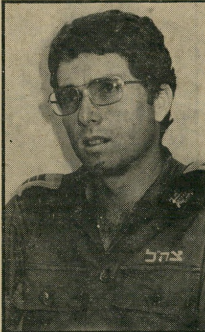
מפקד בית-ספר אבי למורה היו שגיאות-כתיב

כדי להיות קרוב לבנו, לקח איליה את הבן אל הורי אשתו, המתגוררים אף הם בצפת. פעמיים-שלוש בשבוע הוא נוסע