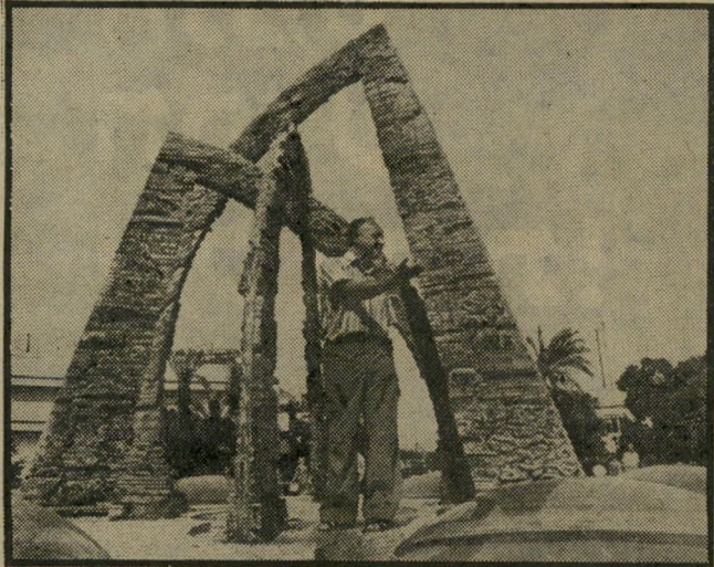
הפסל דויד ויצירתו חומה אטומה

על גיליון 2226 של "העו"לם הזה". בגיליון מצאנו את הפנינים ה"אלה": "כריאיון עם האלוף במ"ל לואיס מתי פלד: "עכשיו כבר יודעים בפנטגון... איך לפטור את תקלות הקומניקציה..." — ואולי לפטור?!? במדור, אתה והלידה