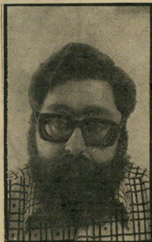
הארי ארטמן כציודם שחן אבל עדין

חבית גדולה של פח נפט, תלויה ויורדת מעל עמוד, כשממנה מש"תלשל חבל תליה. הסמל הוא היות האנושות כרוכה בגלל הנפט בחבל תליה החונק לאט לאט. החבית נמ"צאת בכניסה לגלריה. בפנים, מל"בד עבודות על נייר, המתארות את