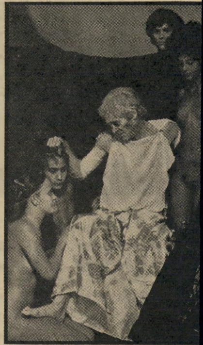
פיטר אוטול הצהיר ב"גלוי שקיבל את תפקיד טיבריוס קיסר, רק בגלל הכסף."