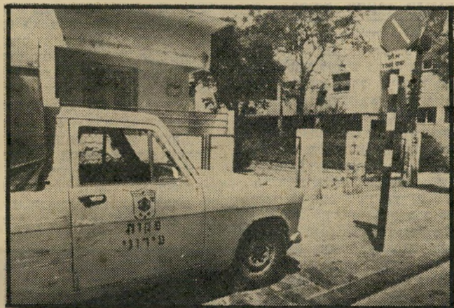
מכונית שד פיקוח עירונית תל-אביב למי עוזר פסקי הדיון?

אין אנשים רבים השגואים יותר על נהגי תל-אביב מסקחי העי-