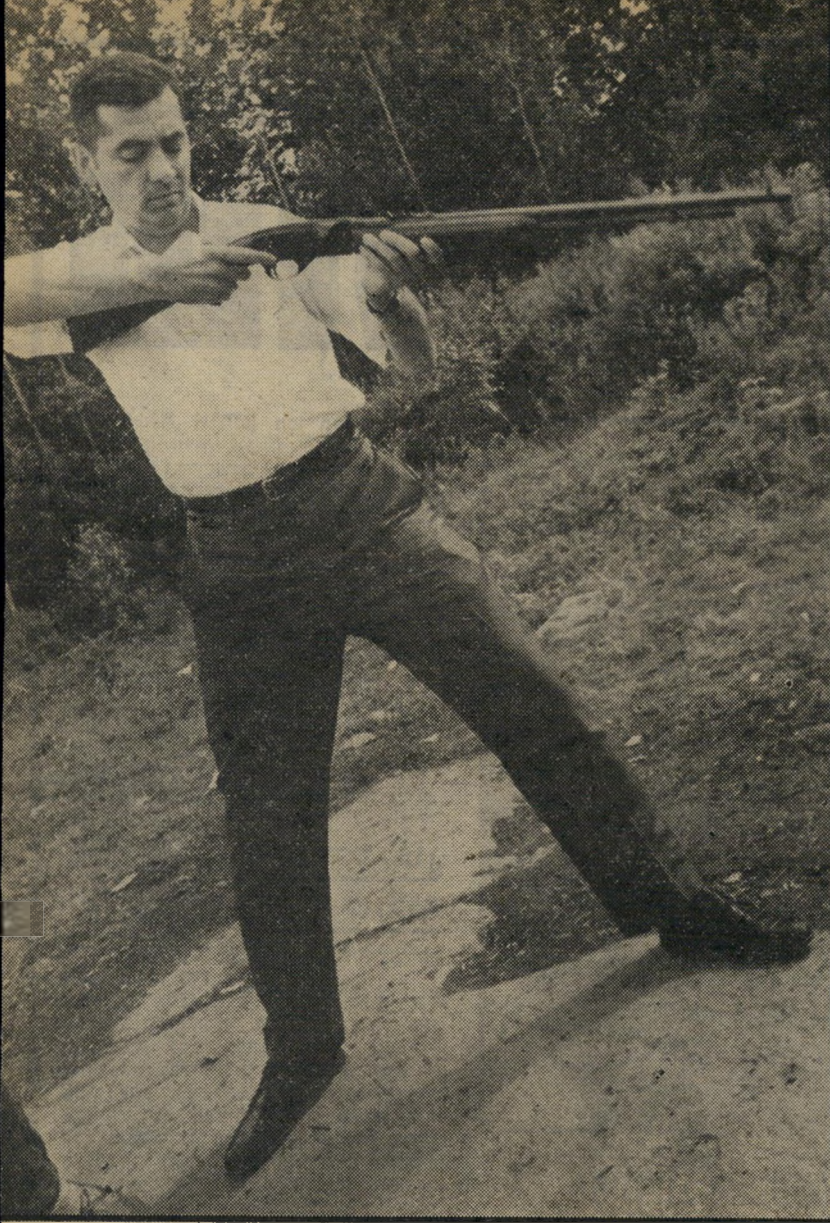
"הרב" מאיר כהנא מתאמן בירי

א חת השאלות שניקרו מייד אחרי שנודע על גילוי מיצבור-התחמושת על גג הישיבה בירושלים היתה: מהיכן הצליחו להשיג כמות כה גדולה של תחמושת? כל קצין וזטר בצה"ל יודע, כי כיום אין כימעט כל בעייה להשיג נשק ותחמושת צה"ליים. לא רק הקנאים הדתיים מרכזים נשק ותחמושת בכמות גדולה. גם העולם התחתון ניוון כולו מנשק צה"לי, ואפילו בני המולות ערביות ירי-בות, שקשה להם יותר להגיע למחסנים צבאיים, חושפים, כאשר גיטש קרב בינינו הם, את השלל הפרטי שלהם מצה"ל. לפני כמה שנים נערך בכפר אבו-סנאן בגליל קרב טילים בין בני שתי המולות. דו"ח מבקרה-המדינה, שפורסם השבוע,