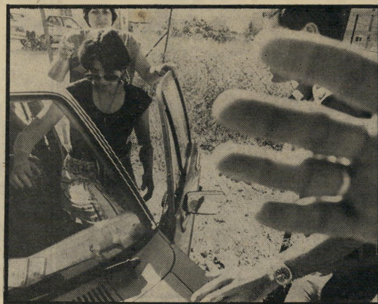
גרופה שוש הזאב

מספר בין היתר על אובדן ציוד באוגדת שריון אחת של צה"ל. מתוך ציוד של 18 מיליוני לירות, שעיקבותיו נעלמו, ה"תחמושת היתה יותר מ-4 מיליוני לירות — וזאת באגדה אחת. לבני-ישיבות ה"הסדר" או לחיילים דתיים אחרים קל יותר מאשר לפושעים מוכרים או לעבריינים לגנוב נשק ותחמושת מצה"ל, מפני ש"אינם חייבים לשכור משתפי-פעולה, אלא יכולים למצוא חברים שישרתו אותם מתוך הזדהות רעיונית — או שהם עצמם משתפים ליד המחסנים. מדי פעם גם נתפסו מצבורים קטנים של תחמושת ונשק בהתנחלויות. פעם תבע צה"ל בגלוי מאחת ההתנחלויות להחזיר