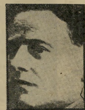
אהרון אהרונסון 15.5.1919

17.5 — המדינאי הציוני, שהיה גם סופר ועיתונאי עב' רי, נחום סוקולוב, נפטר בהי' תו בן 77. בשנות חייו האחר'