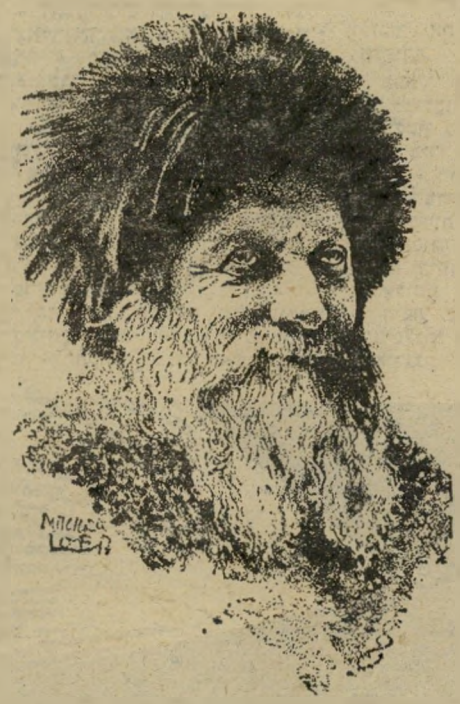
הרב הכהן קוק 17.5.1934

קאהיר, בעיקבות הטיהור ש' ערך אנוואר אל-סאדאת בקרב מתנגדיו בצמרת השילטון. לדברי נשיא מצריים, קשרו ה' שרים המודחים קשר להפלתו. הם הושמו במעצר.