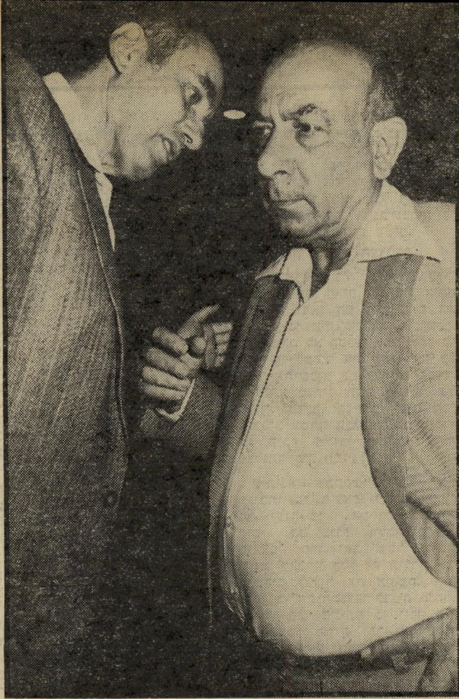
מנהיגי לעם הורביץ ושובל לשימוש מועדון המיפלה