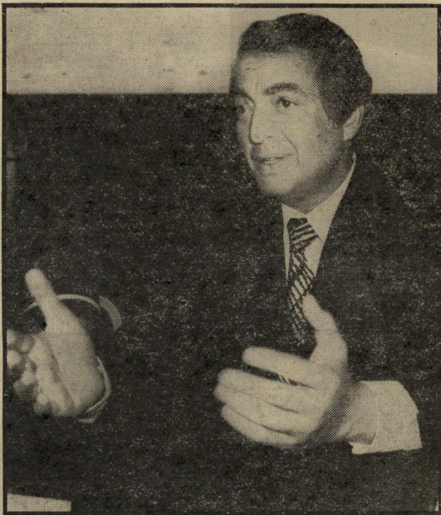
ח"כ פאטו-שרון שלא יגנבו פתקים

המישטרה נזקקה לתצפיות במ-שך כחצי שנה, כדי לוודא את ה-עובדה הידועה כמעט לכל תושב תל-אביבי, כי במלונות הקטנים הפזורים בטיילת ובקצהו של רחוב אלנבי מתנהלים עסקי זנות. התוצאה של מאמץ מישטרי זה ניכרה השבוע בבית-מישפט ה- (המשך בעמוד 50)