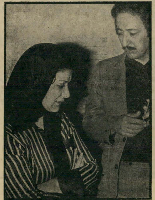
נשיא באניסאדר ואשתו עסקים טובי טעם תאצ'ר

מישטרים רכושניים מתקשים, בדרך-כלל, לנקוט מדיניות עומדת בסתירה לצורכי החברה האזרחית שלהם. לעיתים קרובות אפשר למצוא את המניעים האמיתיים לעמדות מדיניות לא הצהרות מופצצות בפרלמנטים, וב"וודאי לא במסע-היחירות לנשיאות ארצות-הברית. דווקא המדורים הכלכליים עשויים לספק תשובות משכנעות. גם הנסיגות הבריטיות הבלתי-פוסקים לרצות את