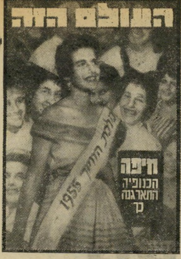
"העולם הזה" 918 תאריך: 19.5.1955