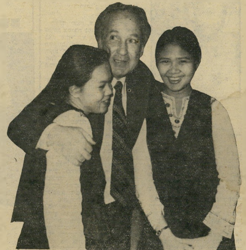
מדינת ישראל וועדות (תאילנדיות) מכונסאי שיף ועובדות למכור ביוקר

"לתימהון כונס הנכסים וחברת נווה מידבר בפירוק, בניגוד למוסכם עימו ובניגוד לדין, פעלה רשות מינהל-סיני של אלוני כדלקמן: