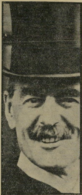
נורויל צ'מברליין 13.5.1939

או על ייחודה הסגולי של אגודת הסופרים העברים בישראל. ואולם יש בכתבה כמה פרטים אישיים מסולפים. שאם לא יוכחשו הם עלולים להתקבל כאמיתות. על כן הנני בזה להגיב עליהם. (המשך בעמוד 8)