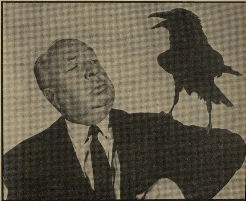
מתחין גאון היצ'קוק ואחת הציפורים המפוזרות שזו בין נגיסה אחת לשנייה

תיהם אחרי שצילמו חומר רב ושיחקו איתו על שולחן העריכה במשך חודשים כדי לראות כיצד אפשר לשלב אותו טוב יותר, אצל היצ'קוק היה הכל כתוב ומוכן מראש, הסרט כולו היה בנוי, כתבנית איתנה, עוד לפני שהתחילו הצילומים. „הצילומים הם החלק המשעמם ביותר של המלאכה, כל מה שצריך לעשות הוא להיות שוטר תנועה ולדאוג שהשחקנים והצוות יעשו בדיוק מה שכתוב בתסריט.“ נהג היצ'קוק לומר. כמי שלא נמנה על המאמינים הגדולים ביכולת הגזע האנושי, הוא לא דרש מן השחקנים שלו אף פעם יותר מדי. „השחקנים הם כבקר“, נהגו לצטט אותו, במדוייק או שלא במדוייק, אבל אם אמר זאת ואם לא, עובדה היא שהשחקנים הם עבורו אביו, משוכלל