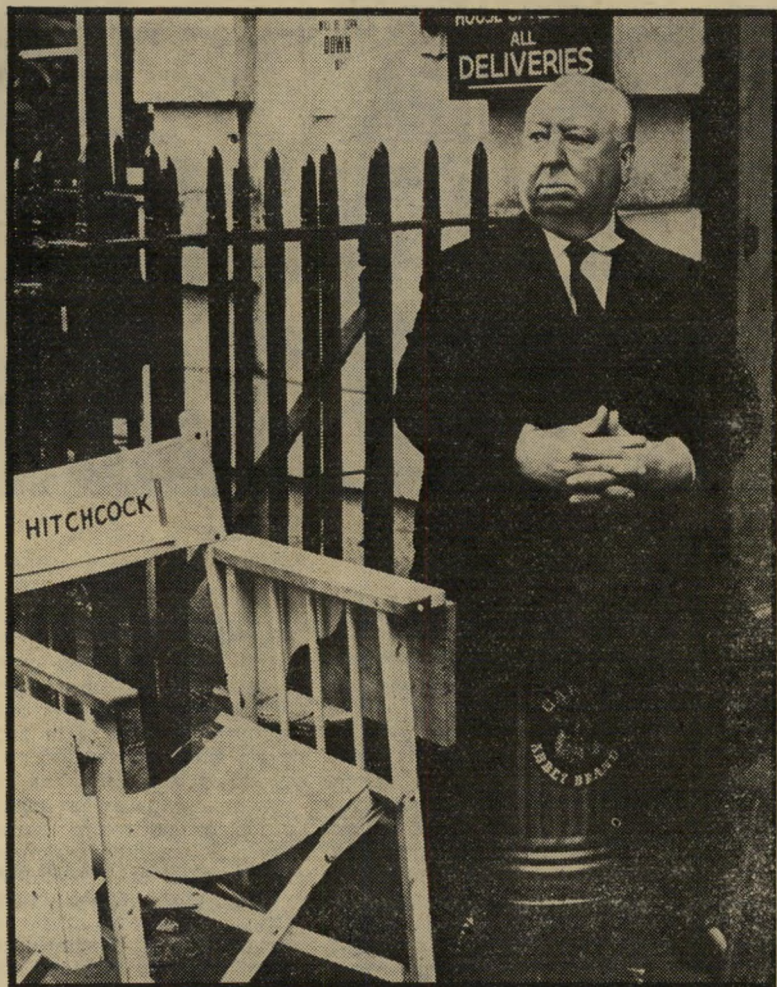
היצ'קוק תהומריסט ירשב עז פחיאשפה החין האנושי לוקח עצמו יותר מדי ברצינות

לחוש חיי-מפשע לחלוטין. גם כשברור לו, כי ידו לא היתה במעל. יש אומרים שתפיסה זו באה לו מן החינוך הישועי שקיבל בצעירותו, ומצביעים על סרט כמו אני מתוודה, שבו כומר מקבל על עצמו בשתיקה את חטאיו של אחד מצאן מפעיות, שהתוודה בפניו, כסרט המייצג בצורה הברורה עמדה זו, אם כי אפשר להבחין בה בסרטים רבים אחרים.