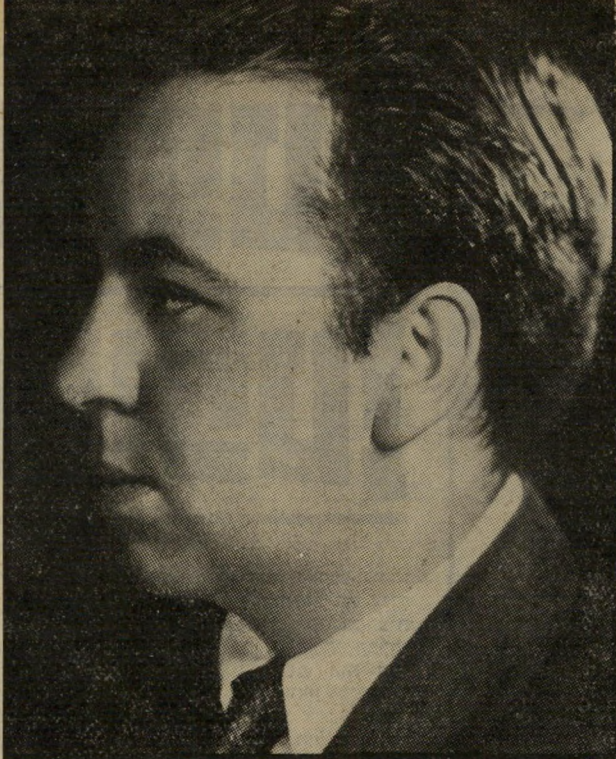
במאי צעיר אלפרד היצ'קוק