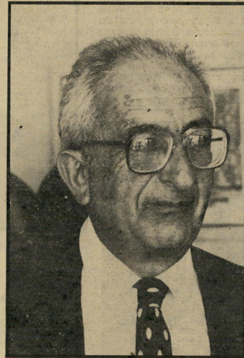
השופט דב ה"ן — על כבודו

לני שופטים יוצאים בימים אלה לגימלאות, השופט מנ"חם בוכוייץ, מבית־מישפט השלום בתל־אביב, והשופט אריה לייב