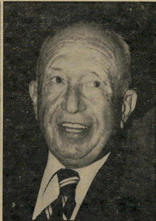
השופט רם — „אני מוחל"

להשתחרר מהתיק, ביגלל העלבור נות והיחס המשפיל שלו זכתה. היא החלפה בעורכי־הדין אחר מהמיש"רד, שהיה ותיק יותר. אך גם זה לא עמד בלחץ, ואחרי כמה ישי"בות חזר אל בעל המישרד וביקש להשתחרר. אך הפעם החליט ללמד את השופט לקח. הוא הגיש בק"שה לשופט, לתקן את הפרוטוקול של המישפט, וכלל בתיקונים אלה את כל מילות הבזו והעלבון שספג במשך הישיבות. השופט דחה מפ"עם לפעם את הדיון בבקשה זו, ולבסוף דחה את הצדדים לפשרה, ובכך סיים את המישפט המביך. עורכי־הדין אינם אהבים לספר את הסיפורים הללו על עצמם. אין זה כבוד גדול לעורכי־הדין לריב עם שופט, והדבר אינו מביא לו תוע"ה שמות שמורים במערכת.