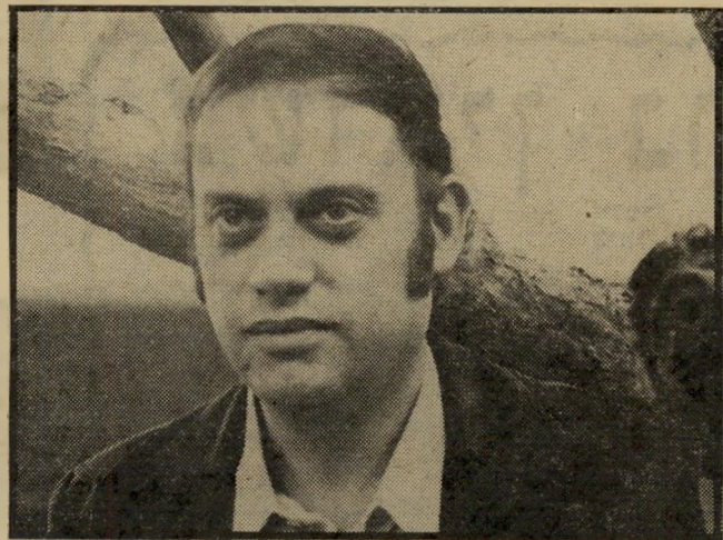
פרנקליט זיכרוני — אס ינצח

מתנאה אבי אלון, אחד מבעלי התוכנית, שהסתבך בעסקיו בארץ (הטולס הזה 2225): "לא זה ביל- בד שהוה שירות דרוש לרבע מיל- יון הישראלים דוברי-העברית, אלא גם למיליוני היהודים, הרו- אים בירושלים וכישראל את ביתם הרוחני..."