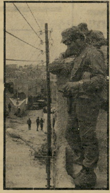
השמירה על בית הדסה לא היתה יעילה לדברי אנשי הקרייה. למעלה: חייל שומר למחרת הפיגוע. למטה: רופא מטפל בפצוע.

רידה, עד לתהלוכה של ליל-השבת הבא. אך לפתע, ללא כל רמז מוקדם, נפ- תחה האש. הכביש כולו נשטף בכדורי רים, שניתזו על האספלט וברסיסי רימור נים. הדם נשפך על הכביש, הזעקות מילאו את החלל. תוך שניות ספורות נמוג העשן. הדם המשיך לזרום והזעקות אף גברו. נשות הדסה נסוגו אל תוך הבניין. הגוש הראשון של הנשים והילדים התפזר לכל עבר. הגברים התכוססו בדמם. עבור שישה מתושבי קריית-ארבע ואור- חיהם נסגר המעגל. 16 אחרים מתחיי לים עתה דרך ארוכה של מילחמה עיי- קשת בנכות ובפציעה. בגדה המערבית נפ- תח עידן חדש.