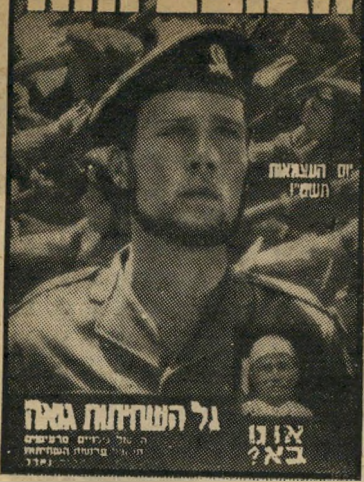
העולם הזה 916 תאריך: 5.5.1955

גיבור ישראל, שכחנה את ההגנות בענינו של גיבורי ישראל סימן טוב גנה. מדור הפירור פתח השבוע לפני 25 שנה כמלפני הציונות. כמו כן פורסם בגיליון המדור "ספר לסכתא" שבכרית לילי גילוי (ראה) מילון גילוי הקצר. בשער הגיליון: חייל במצעד יום העצמאות תשמ"ו.