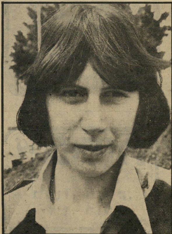
מתלוננת בין או לבישול?