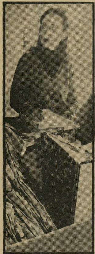
פרקדיטה דבורין כמה תיקים יש באמת?

יבואנים ומפיצים בנרתיים בישראל - י.ד. נוסקים ת"א, הסוגרס 44, 8322367