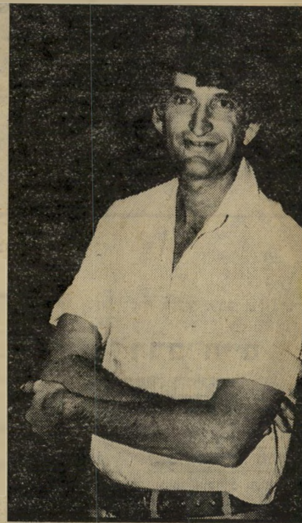
אלוף בן-גדל יאנוש ציוני?

אולם בדרך מיסטרית הגיע אל אלוף-פיקוד-הצפון, האלוף אביגדור ("יאנוש")