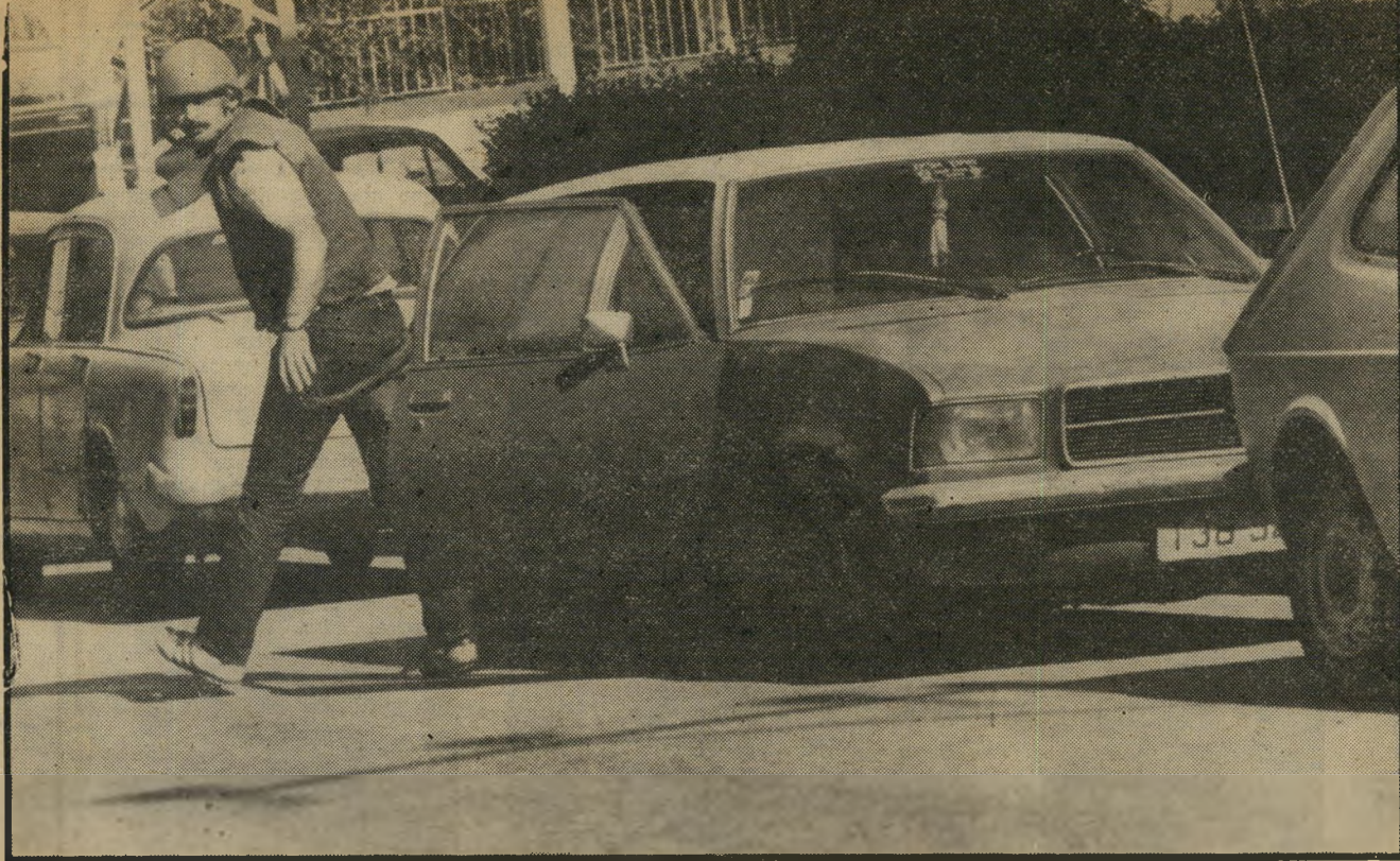
חבלן המישטרה, באפודת מגן, בצאתו מהמכונית מי הטמין את הרימון?