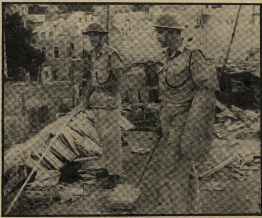
שוטרים חמושים במהומות ואדי סאזיב התולעים שעיצבו את ישראל של היום

מצפון או להזיל דימעה ללא בושה, השנים שלאחר מלחמת ששת-הימים (שהיא הי פרק האחרון בסרט) עשו את הישראלים חשדנים יותר, ציניים יותר, וזהירים הרבה יותר. קשה להגות שמראה מנתם בגין בבגדיים, הטובל בכריכה, היה מחמם את הלב כפי שעשה זאת דויד בן-גוריון כאשר הסכים להצטלם, צף על פני המים, בחברת פולה הדואגת, היום בוודאי היו קוראים לזה תעלול פירוטומת, או לא חשד בכך איש.