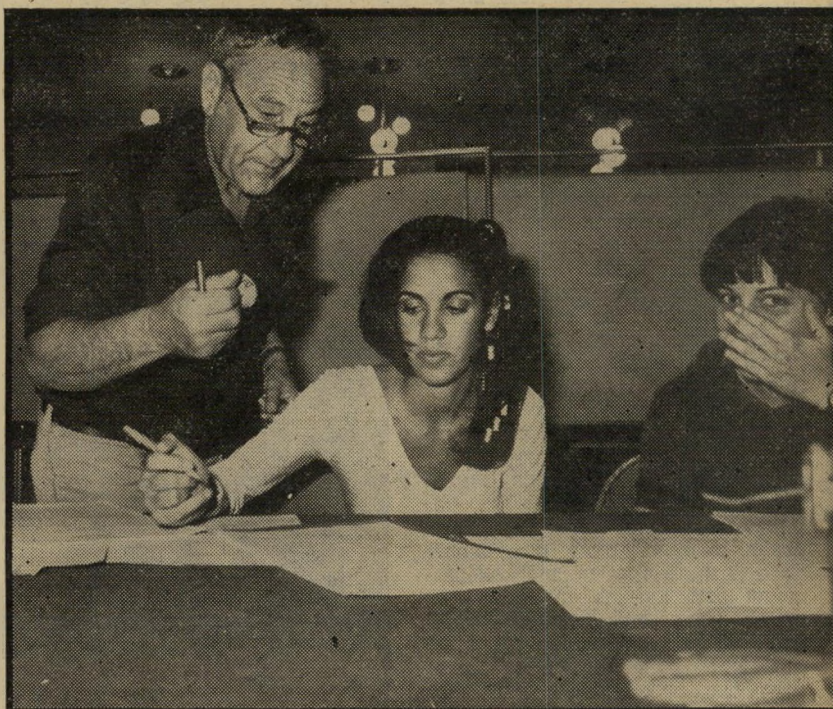
מניין התוצאות תוצאות לא חשובות

ו זהו מיפלגת-צ'ללים! הודה אחד מראשי המיפלגה הליברלית. "אין לה חברים אמיתיים, אין לה יעדים אמיתיים, אין לה מנהיגים אמיתיים." ואכן — שום אירוע מיפלגתי בשנים האחרונות לא סימל את ההתנוונות הנוראה של החיים הפוליטיים בישראל כמו הבחירות שנערכו השבוע במיפלגה הליברלית. ההצגה שנערכה במקביל בתנועה הדמוקרטית של ייגאל ידין לא היתה כה עגומה, מפני שאיש אינו מתייחס ברצינות לשריד אומלל זה של תרגיל פוליטי חד-פעמי. אך המיפלגה הליברלית היא אחת הוותיקות בארץ. יש לה שורשים עמוקים בהיסטוריה הציונית, והיא מילאה תפקיד חשוב בתולדות המדינה. התנוונותה היא את מבשר רעות. במשך כמה שבועות הופיעו בעיתונים מודעות של סיעות שונות במיפלגה. גם הן היו סימפטום להידרדרות המערכת הפוליטית. במודעות-בחירות, הן של מיפלגות, הן