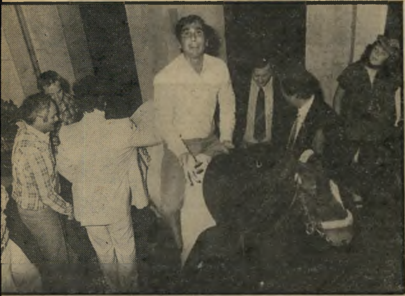
עיוור על הסוס עיוור נכה צה"ל רוכב בלובי של חלון מרינה על הסוס שנתרם לנכים. מימין אפשר להבחין בפלאטו משוחח עם יעקובסון. כעבור דקות אחדות