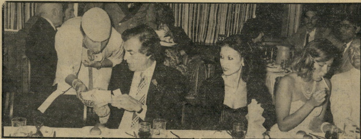
שרון יחד עם רעייתו בנשף יום-העצמאות של הנכים. בתמונה נראה פלאטו כשהוא רוכב כרטיסים להגדלה, שנערכה במקום, ונותן תמורתם התחייבות של 2000 לירות.

פ לאמץ, אמץ יחסי-הציבור נדלק כששמע על הסוס. "אני רוצה לתרום את הסוס. אני לא מוכן לתת שום תרומה אחרת. מלבד הסוס", הוא הודיע ליעקובסון. כפי הנראה ראה כבר פלאטו בעיני רוחו את תמונתו יחד עם עיוורים נכי צה"ל ועם סוס המוצב בחדר האוכל של המלון, מתפרסמת בעיתונים. יעקובסון ידע כבר עולה הסוס וכמה עולה האחזקה שלו ונקב בסכום של 50 אלף הלירות בפני פלאטו. "אין בעייה, אני משלם", הודיע לו הח"כ מסביון. יעקובסון טילפן לסנדל, סיפר לו על השיחה עם פלאטו וביקש ממנו לוותר על הסוס ולתרום את הסכום בצורה אחרת. סנדל הסכים. הוא גם מסר ליעקובסון סוף את כתובתו של מוכר הסוס ויעי-קובסון מסר אותה לפלאטו. "לי אין זמן להתעסק עם סוסיים", אמר לו פלאטו. "קח את הסוס ואני מייד מוציא לך צ'ק". יעקובסון נהג כך. הוא סיכם את העסקה עם מוכר הסוס, הבטיח לו את הצ'ק עוד לפני מועד הנשף ואף השיג תרומה מבית-אופנה להכין שמכת-רכיבה בה מיוחדת שעליה נרקם סמל המלון והשם שנקבע לסוס: טייפון-מרינה. עד יום לפני הנשף לא הגיע הצ'ק של פלאטו. יעקובסון טילפן אליו, ואז הסי (המשך בעמוד 44)